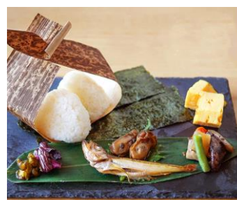
登米産米使用 東北6県おにぎり 700円 (モーニングメニュー) ※東北6県のおかずから2品お選びいただけます