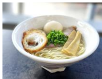
気仙沼産サンマ煮干し ラーメン油麩載せ (三陸産ワカメ麺)

レストランでは、気仙沼・登米の豊富な海の幸・山の幸を使ったオリジナルメニューを取り揃えました。仙台空港でしか味わえない気仙沼・登米の旬の味をお楽しみください。