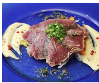
気仙沼産カツオの カルパッチョ 880円