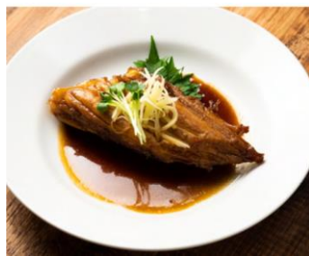
気仙沼名物 ハーモニカの煮付け 880円