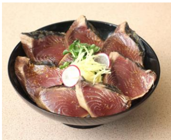
登米産米使用 気仙沼産カツオの漬丼 1,200円