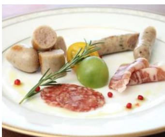
登米 伊豆沼農産の シャルキュトリー 980円