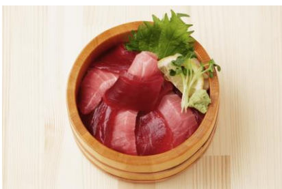
宮城県気仙沼 白福本店 昭福丸 本マグロ二色丼 中トロ・赤身