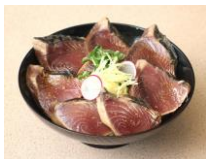
気仙沼産カツオの漬け丼 (登米産米使用)