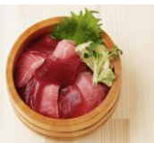
気仙沼 昭福丸 本マグロ二色丼