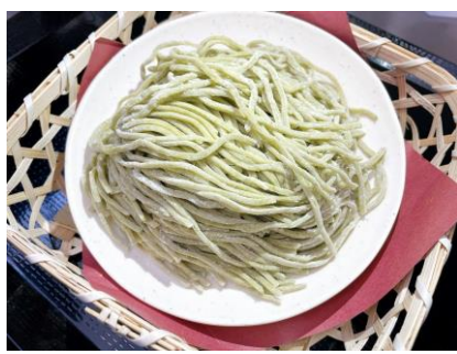
気仙沼産サンマ煮干しラーメン 油麩のせ 900円

※三陸産わかめを練りこんだ特製麺 を使用しています。 わかめ麺はその他の出汁にも合わせ られます。