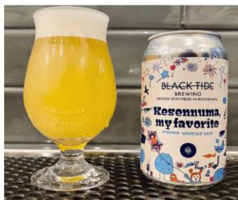
クラフトビール BTB Kesenuma, my favorite 880円