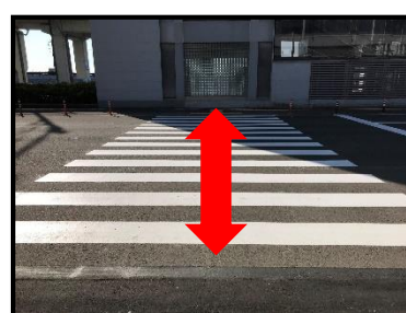
お客様第1駐車場(予約専用エリア側)と国内線到着口間が直線的に結ばれ、移動距離が短縮されました。