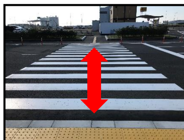
お客様第1駐車場(出口側)とターミナルビル間の移動距離が短縮されました。

仙台国際空港株式会社は、今後とも安全・快適に仙台空港をご利用いただけるよう、利便性向上に努めてまいります。