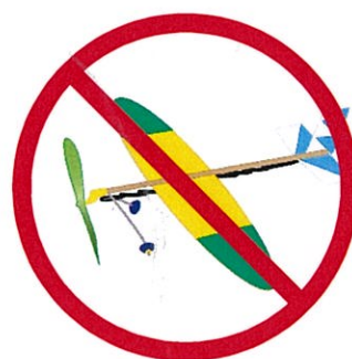
模型航空機の飛行 (ゴム動力機など)