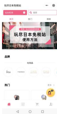
▲仙台空港の専用カウンター（左）と専用ウェブサイト（右）

（参考）本日この資料は、国土交通記者会、ときわクラブ、宮城県政記者会にお届けしています。