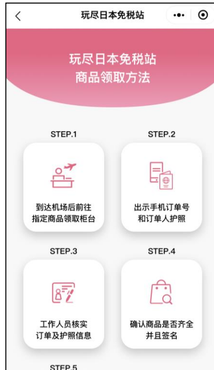
▲商品受け取り方法の説明