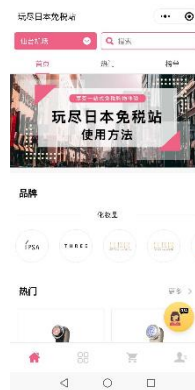
▲仙台機場的專用櫃檯（左）和專用網頁（右）