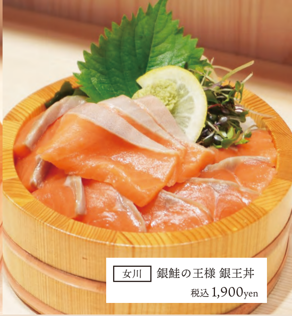
女川 銀鮭の王様 銀王丼 税込 1,900yen