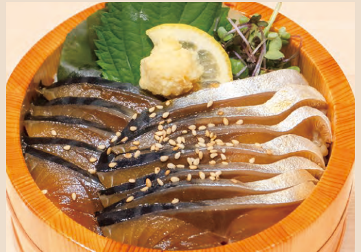
石巻 金華サバ漬け丼 税込 1,900yen