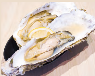
石巻 牡蠣 2個セット 税込 990yen