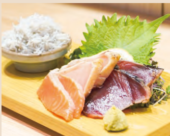
石巻 刺身盛り合わせ 税込 1,700yen 盛り合わせのお魚は季節ごとに変わります