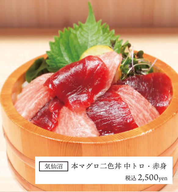
気仙沼 本マグロ二色丼 中トロ・赤身 税込 2,500yen