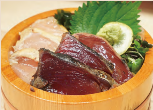
塩竈 一本釣り 薬焼き ビンチョウマグロ・カツオ丼 税込 1,900yen