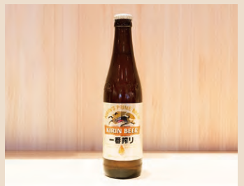
石巻 ビール・日本酒・ワイン 宮城のお酒各種取り揃えております