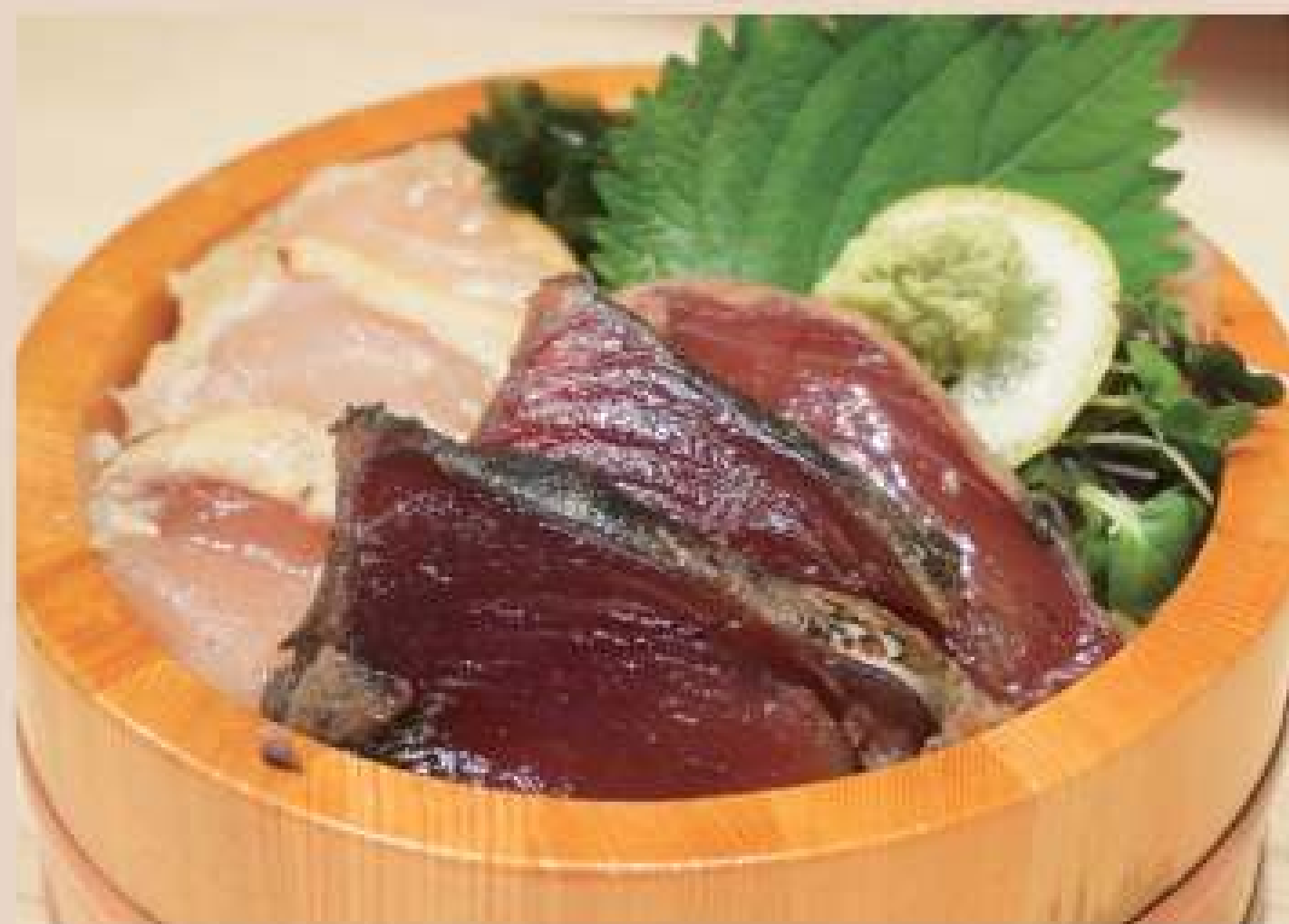
塩竈 一本釣り 葉焼き ビンチョウマグロ・カツオ丼