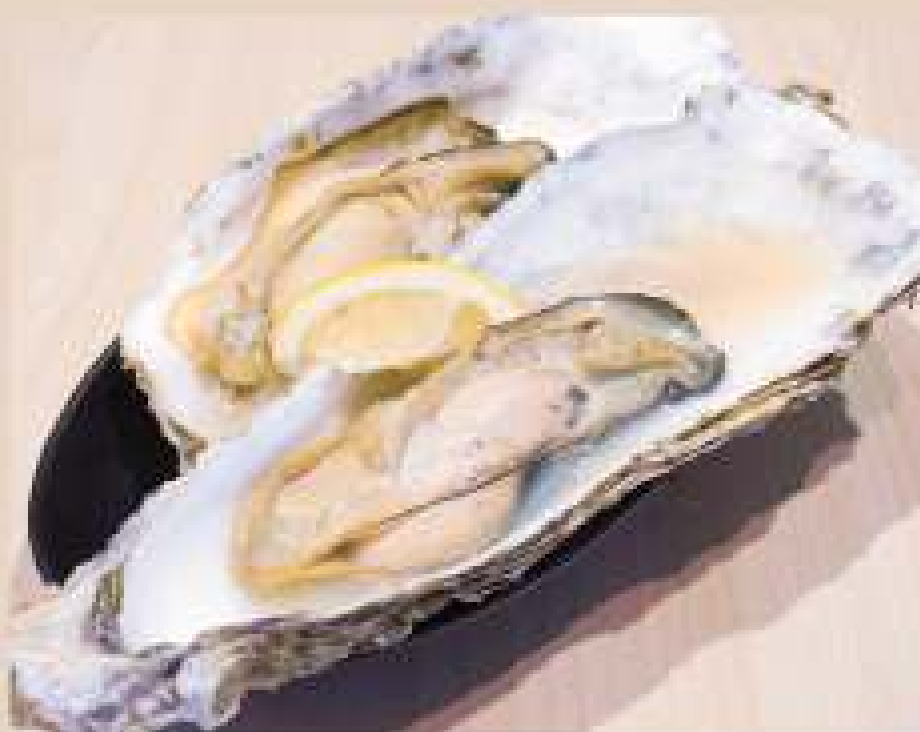
石巻 牡蠣 2 個セット 税込 990yen