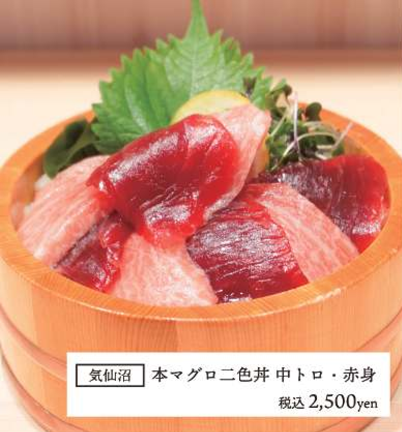
気仙沼 本マグロ二色丼 中トロ・赤身 税込 2,500yen