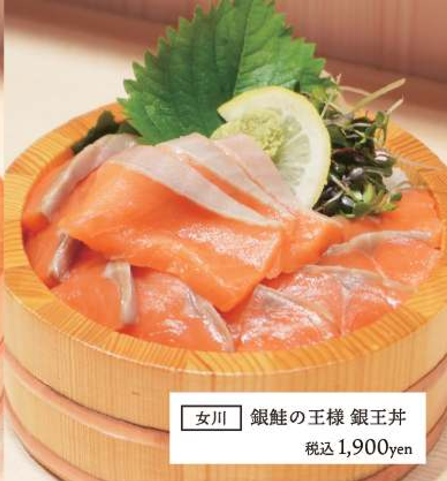
女川 銀鮭の王様 銀王丼 税込 1,900yen