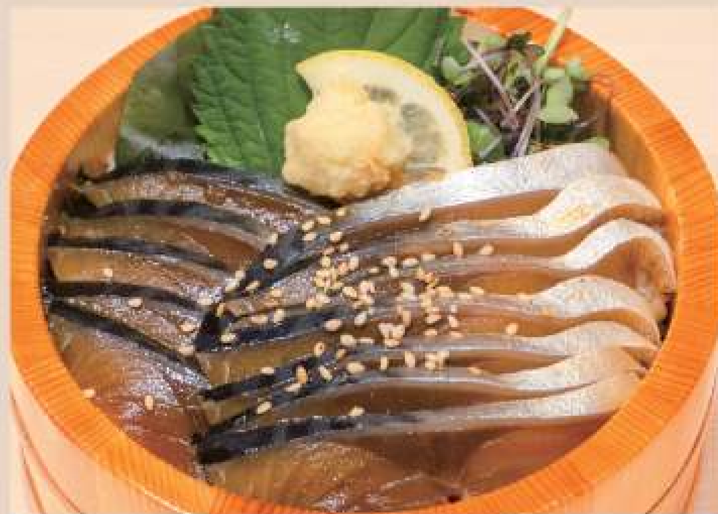
石巻 金華サバ漬け丼