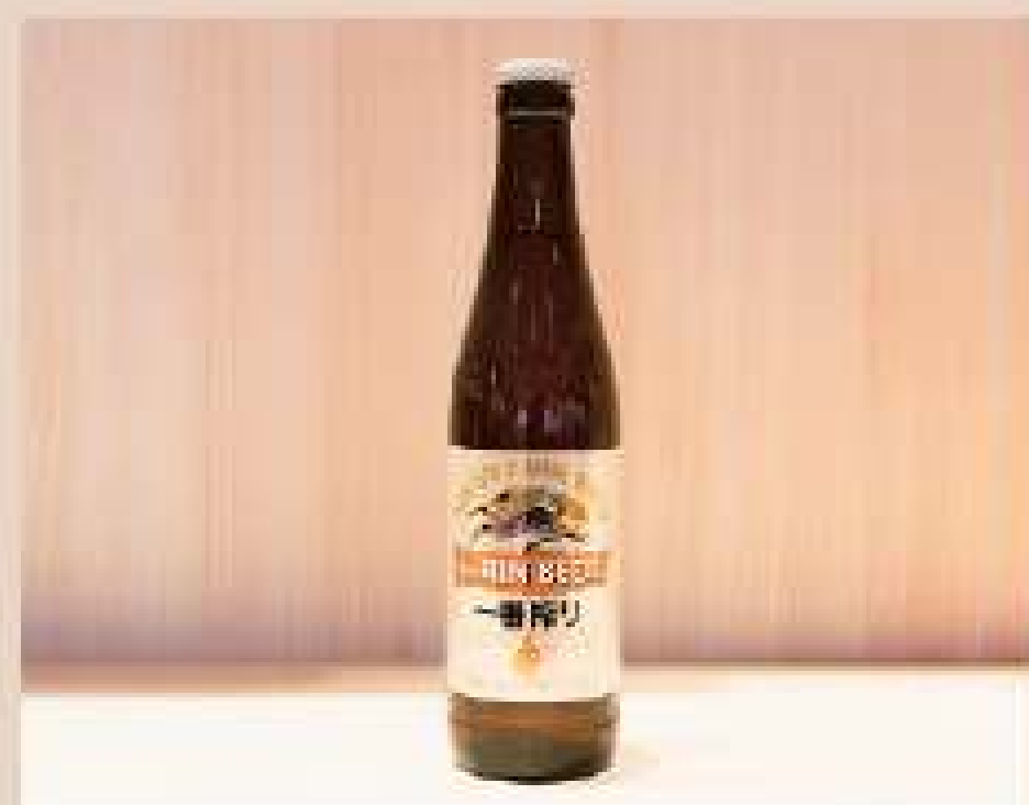
石巻 ビール・日本酒・ワイン 宮城のお酒各種取り揃えております