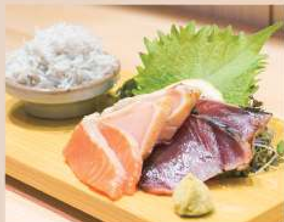
石巻 刺身盛り合わせ 税込 1,700yen 盛り合わせのお魚は季節ごとに変わります